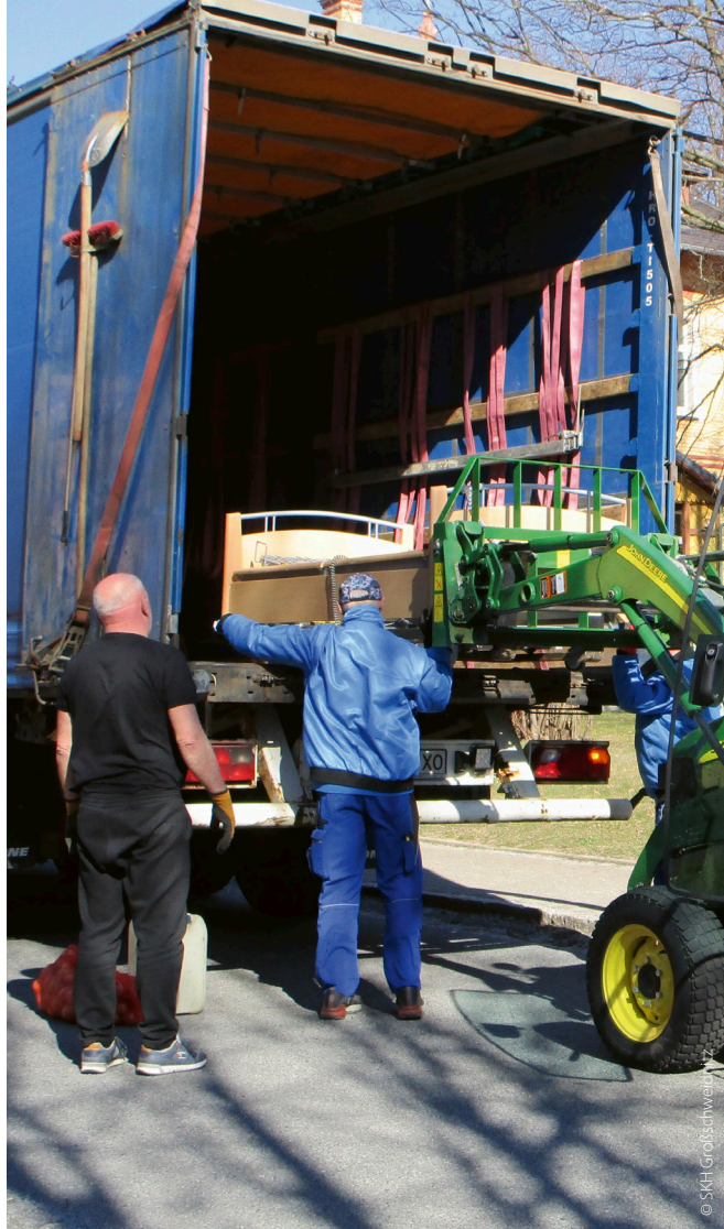
links: Übergabe des Krankentransportwagens an der polnisch-ukrainischen Grenze rechts: Zehn Pflegebetten wurden vom Krankenhaus Großschweidnitz gespendet und mithilfe eines Traktors in den LKW gehoben.

ärztebund (WMA), der Ständige Ausschuss der Europäischen Ärzte und das Europäische Forum der Ärztenverbände in der WHO-Europaregion gemeinsam mit den Ärztekammern von Polen und der Slowakei sowie dem slowakischen Ärzteverband den »Ukraine Medical Help Fund« ins Leben gerufen. Bereits Anfang Mai waren dort über 2,2 Millionen Euro an Spendengeldern eingegangen.